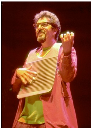
CYRO BAPTISTA, percusionista fabuloso.