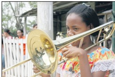
NIÑA TROMBONISTA de Nelson Mandela.

Los niños músicos de Nelson Mandela no han surgido por generación espontánea sino que son el fruto madurado de un largo sacrificio y