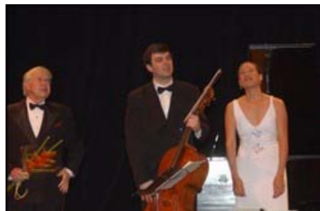
ANDRÉS DÍAZ, el gran músico chileno en los barrios de Cartagena.

Los conciertos didácticos se realizarán en el Centro Cultural Las Palmeras (jueves 3 enero), la Institución Educativa 14 de febrero (viernes 4 de enero, 9 a.m.), y la Iglesia María Auxiliadora (sábado 5 de enero, 9 a.m).